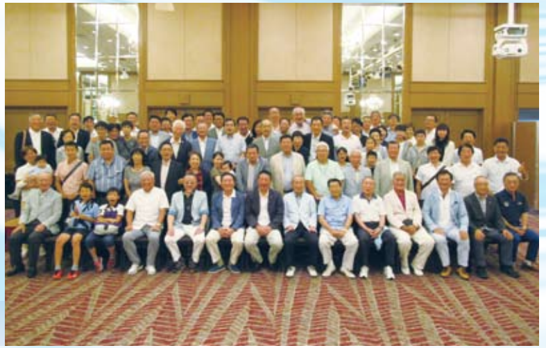
エクシブ山中湖にて