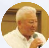
中 締め 守会長エレクト 長井