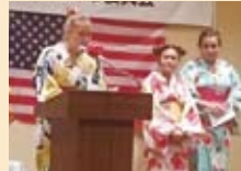
サン市派遣高校生