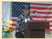
立川市派遣高校生