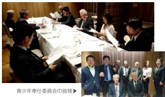
青少年奉仕委員会の皆様▶

2/21(金)ホテル日航立川 東京にてチャリティー・クリスマス・コンサートの慰労も兼ね、青少年奉仕委員会炉辺が開催されました。