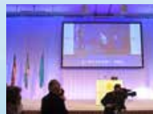
寛仁親王妃信子殿下 ▶