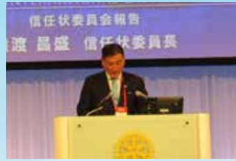
▲ 信任状委員会報告