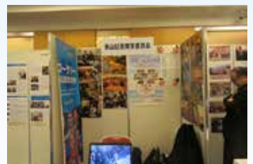
▲ 米山記念奨学委員会