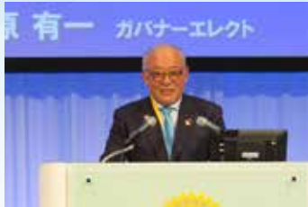
▲ 福原有一 ガバナーエレクト