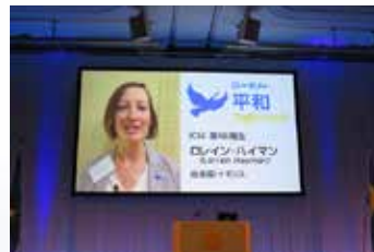
▲ ローター財団平和フェロー 18期生