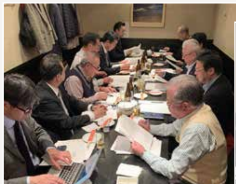
2/28(金)中華料理 山城にて開催