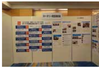
▲ ロータリー財団委員会