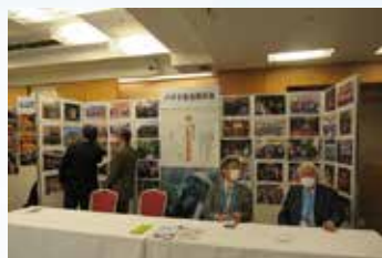
▲ バギオ基金委員会