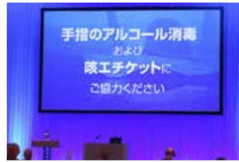
▲ コロナウイルスの影響でマスク着用