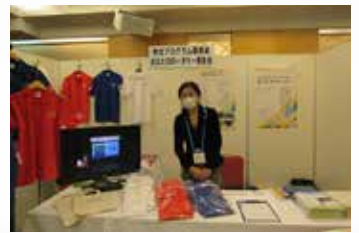
▲ 奉仕プログラム委員会 あなたのロータリー委員会