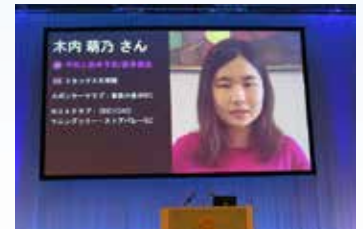
▲ ローター財団奨学生